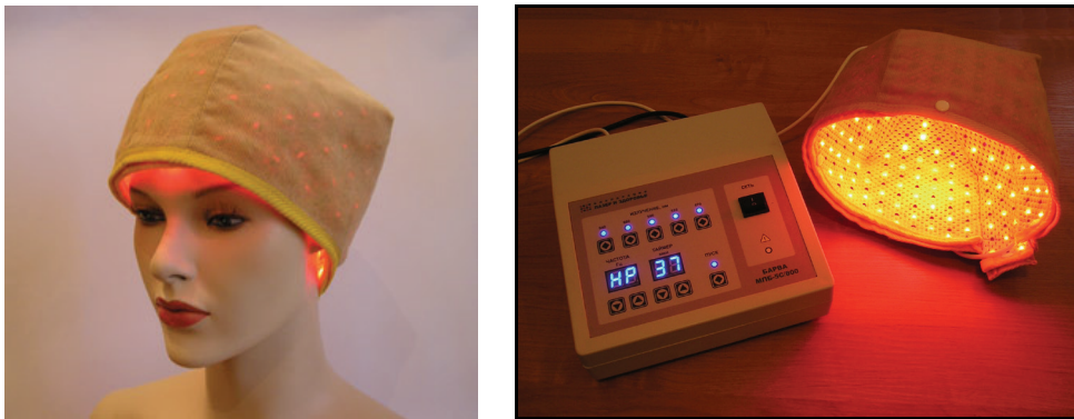
Рис. 1. Аппарат фототерапии болезни Альцгеймера и других заболеваний головного мозга «Барва-ЦНС»

Количественное распределение светодиодов в аппарате «Барва-ЦНС» представлено в таблице 2.