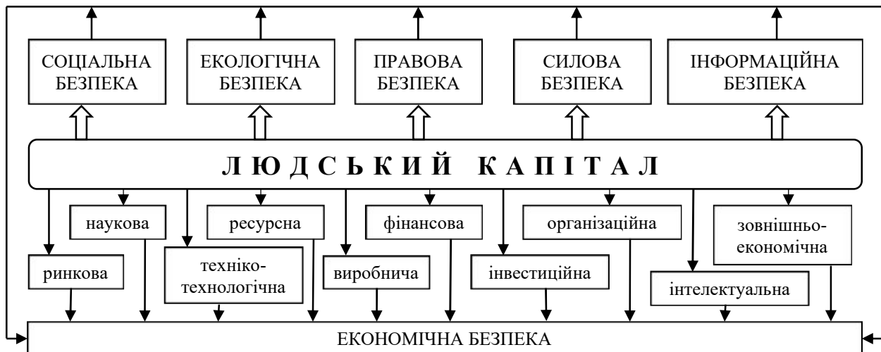
Рисунок 2 – Вплив людського капіталу на складові системи безпеки функціонування підприємства

Звернемо увагу, що керівництво підприємства несе певний ризик, здійснюючи інвестиції в людський капітал [7]. Трудовий договір передбачає тимчасове використання роботодавцем здібностей працівників, отже, після закінчення терміну трудового договору працівник може перейти на роботу до іншого підприємства. В основному саме ця причина є стримуючим фактором зростання інвестицій в людський капітал. Схематично вплив людського капіталу на складові системи безпеки підприємства представлено на рис.2.