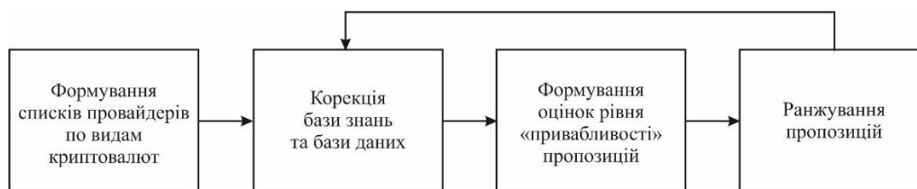
Рисунок 5 – Етапи роботи технології оцінювання привабливості пропозицій

Структуру технології наведено на рис. 5.