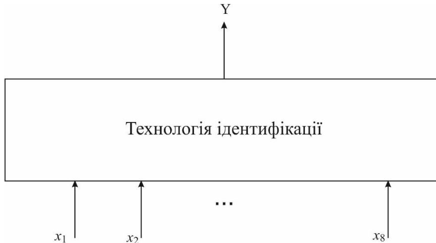
Рисунок 1 – Технологія ідентифікації рівня привабливості

Одночасно він може бути представлений як вхідний вектор змінних X(x_1, x_2, \dots, x_8) для технології ідентифікації, на виході якої одержуємо показник рівня «привабливості» пропозиції Y , так, як це наведено на рис. 1.