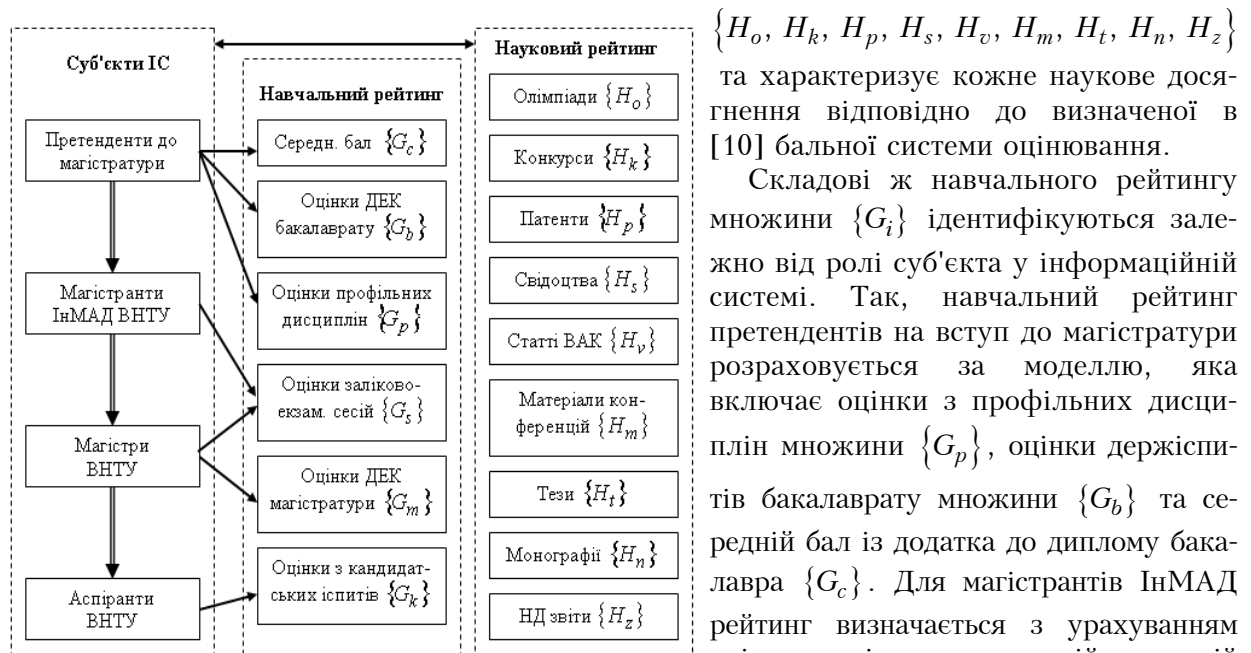
Рис. 1. Суб'єкти АІС наукового і навчального рейтингу

До вхідних параметрів інформаційної системи моніторингу та підтримки прийняття рішень відносяться наукові досягнення суб'єктів, що проілюстровані на структурній схемі рис. 1 у визначених множинах \{H_i\} , де i – тип наукового досягнення суб'єкта інформаційної системи. Для аналізу різномірної інформації про олімпіади, конкурси, публікації, патенти і т.п. створена критеріальна система оцінювання, що використовує множини