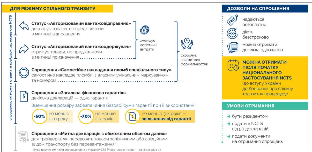
Рис. 3. Спрощення від застосування NCTS для українських трейдерів [18]

**Підприємство, яке має статус авторизованого вантажоодержувача може отримувати товари, що переміщуються під процедурою спільного транзиту, без їх пред'явлення митниці призначення