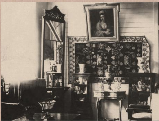
Фрагмент експозиції 1930-х років

В 1927 році Густав Брілінг розпочав роботу щодо створення відділу природи, було відкрито відділ революції, основу якого склали колекції сатиричних журналів та революційних газет 1905 р., велика колекція плакатів часів Української революції та НЕП'у.