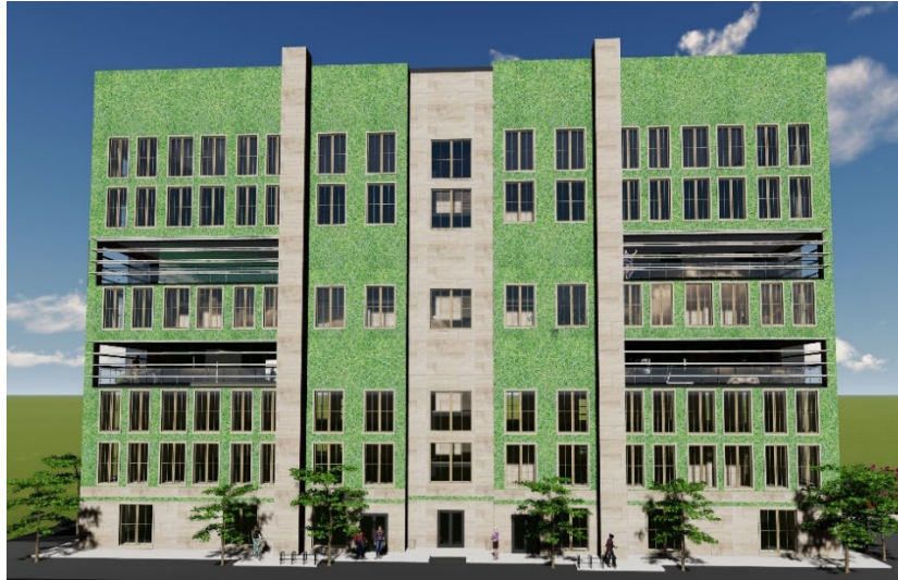
Рис. 2. Вид переднього фасаду багатоповерхового екологічного житлового будинку

Дах будівлі також поєднує інновації та ідеї. Нерухомі вітряні генератори, сонячні панелі та збір опадів у резервуар для скидання у турбіни ГЕС – ці системи в сумі здатні забезпечити автономне живлення будинку протягом 24 годин, а при надлишку електроенергії її можна експортувати у міську електромережу (рис. 3).