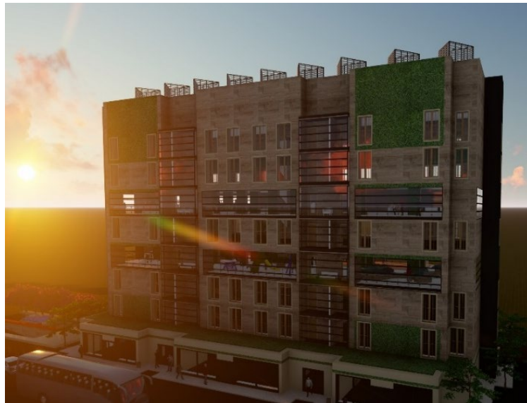
Рис. 1. Спроектована модель зеленого житлового будинку

Спроектований багатоповерховий будинок (рис. 1) складається зі стінових панелей, за допомогою яких процес зведення значно прискорюється (здача будинку в експлуатацію через 8 місяців від початку зведення) та робить запропонований будинок набагато дешевшим в порівнянні з іншими. Панельне будівництво – це швидко, надійно та недорого. Дана конструкція включає в собі 8 наземних та 3 підземних поверхи. Паркінгова зона розрахована на 54 паркомісця і має особливий функціонал використання. На 2-ому поверсі можна легко монтувати/демонтувати перегородки для бомбосховища. Туди підведені два окремих канали комунікацій та система мікроклімату. Завдяки товстому шару бетону та ізолюючих матеріалів приміщення захищене від радіаційної небезпеки. Отже, площа може бути використана для різних цілей. Найнижчий підземний поверх обладнаний невеликою ГеоТЕС, а також гібридним інвертором. Перший рівень парковки обладнаний системою малошумних гідротурбін, що перетворюють падаючу з даху воду у енергію. В літній час використана вода збирається у резервуар для поливу газону, а в зимовий – для миття автомобілів від бруду та протижеледних засобів.