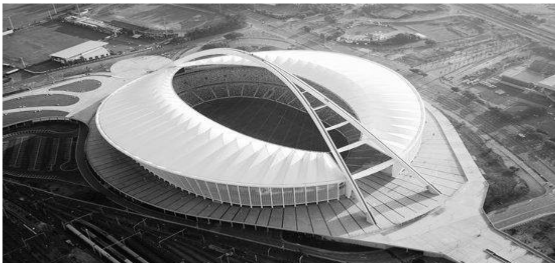
Рис. 3. М. Дурбан, Південно-африканська республіка. Проектна група «Ibhola Lethu Consortium»

Значні перетворення у галузі архітектури спортивних споруд відбуваються у Південноафриканській республіці. Так, у м. Дурбан спеціально для проведення Чемпіонату світу з футболу 2010 року було побудовано багатофункціональний стадіон “Мозес Мабіда”, розрахований на 70000–85000 глядачів. Нині цей стадіон виконує роль визначного місця, своєрідної візитівки Дурбана (Рис. 3). Переможцями міжнародного конкурсу стала група “Ibhola Lethu Consortium”, яка складається з німецької майстерні “GMP Architekten”, інженерного бюро “sbb Schlaich, Bergermann und Partner” та з 32 південноафриканських архітектурних фірм. До речі, інтернаціональний склад архітектурних фірм, груп, бюро, що беруть участь у конкурсах на зведення спортивних споруд є однією з особливостей нашого часу. Завдяки цьому стало можливим ефективніше враховувати особливості багатьох національних культур в процесі проектної діяльності [4].