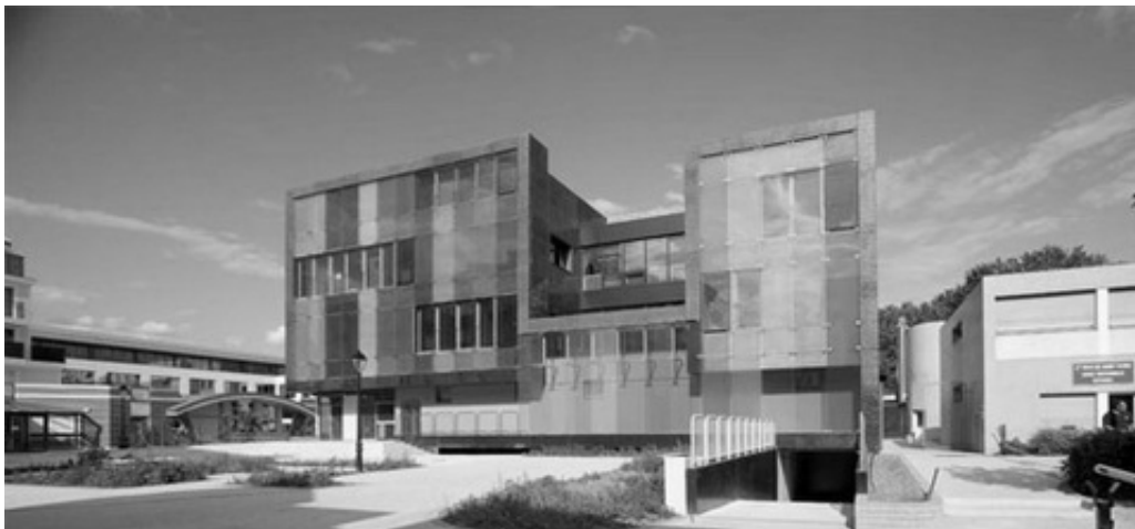
Рис. 4. Молодіжний центр для спорту, тренування і відпочинку в Сен-Клу (Франція)

Одним з актуальних напрямків розвитку архітектури спортивних споруд ХХІ століття стало проектування будівель, які викликають позитивні емоції у тих, хто їх розглядає. Саме думками про важливість піднесення настрою відвідувачів зумовлено вибір архітекторами, дизайнерами та інженерами бюро KOZ Architectes яскравих кольорів для проектування й спорудження центру спорту та дозвілля в м. Сен-Клу (Франція). Сміливе кольорове вирішення, простота, вдалилий вибір форми споруди зумовили появу незвичайного архітектурного об'єкта, що сприймається як справжнє диво тими, хто зустрічається з ним у типовій французькій провінції. Споруджена для занять спортом та для відпочинку населення будівля вирізняється яскравим колірним вирішенням й неначе протистоїть “сірому”, безбарвному оточенню житлових кварталів.