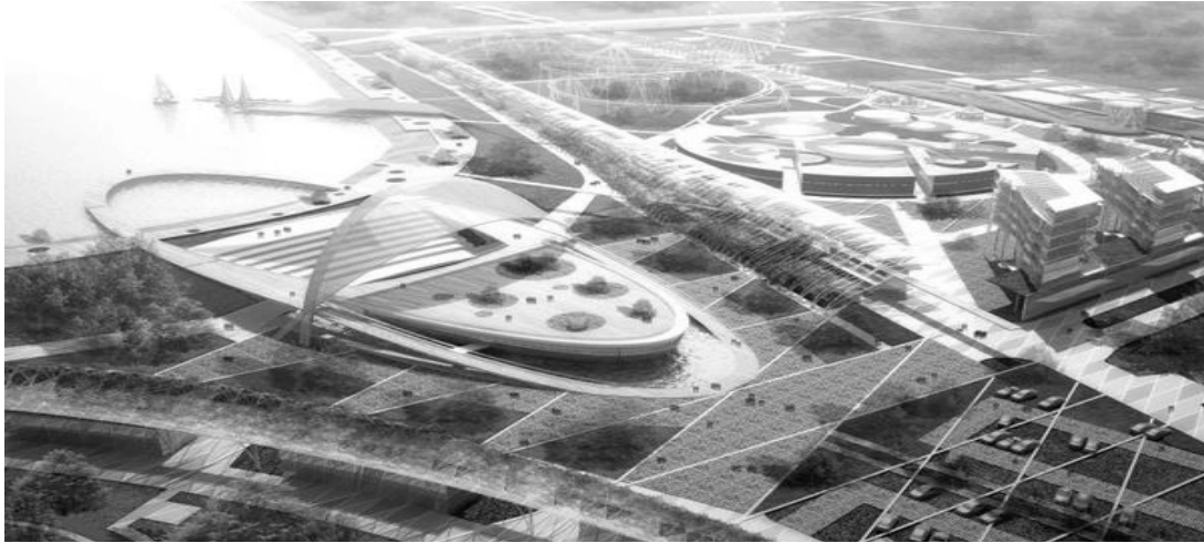
Рис. 2. Спортивно-оздоровчий тренувальний комплекс “Новоп’ятигорське озеро”. П’ятигорськ, Росія. “Архитектурная мастерская А. Асадова”

Ще одна важлива тенденція в створенні сучасних спортивних споруд значною мірою зумовлена тим, що часто на перший план спортивних змагань виходить швидкість, яка є головною складовою Олімпійських ігор, зокрема зимових. У зв’язку з цим у місті Ванкувері (Канада), наприклад, були модернізовані існуючі та побудовані нові спортивні споруди з урахуванням найсучасніших досягнень архітектури. Типовим вирішенням проблеми розміщення великої кількості глядачів під час змагань, врахування досягнень науки і техніки й при цьому збереження інфраструктури існуючих спортивно-тренувальних споруд стала побудова так званих тимчасових стадіонів, два з яких і було споруджено у Ванкувері до зимових Олімпійських ігор [4].