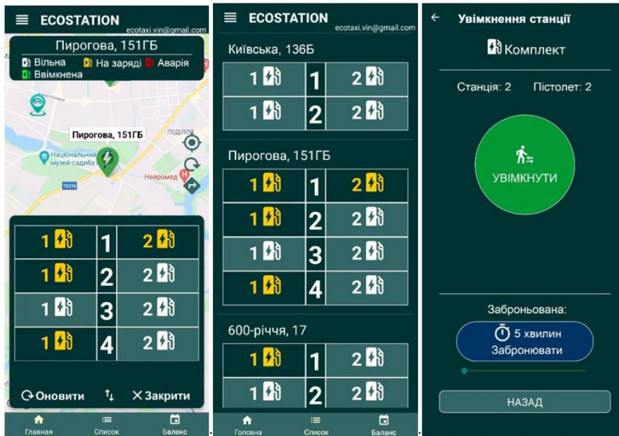
Рис. 3. Модуль керування зарядними станціями

Після фінальних тестів, перевірки на помилки та баги, підготовки політик та правил використання додатку, його було опубліковано в магазині додатків Google Play (PlayMarket) та опубліковано в публічний доступ як реліз (рис.4).