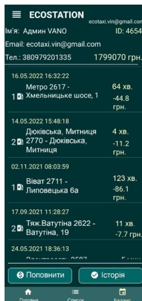
Рис. 2. Модуль особистого кабінету.

Далі було розроблено модуль особистого кабінету (рис. 2) який би дозволив передивлятись особисту інформацію користувача щодо свого акаунта, баланс, можливість його поповнення та історію використання зарядних станцій.