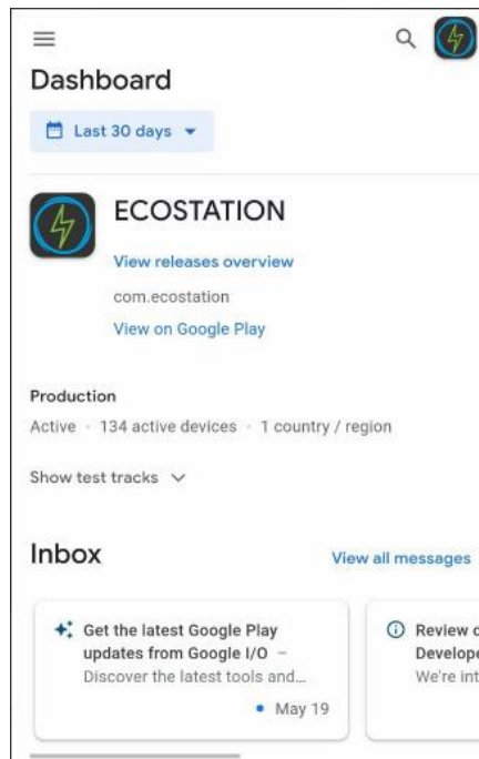
Рис. 4. Опублікований додаток в магазині додатків Google Play

Після фінальних тестів, перевірки на помилки та баги, підготовки політик та правил використання додатку, його було опубліковано в магазині додатків Google Play (PlayMarket) та опубліковано в публічний доступ як реліз (рис.4).