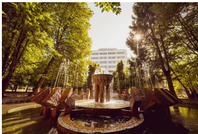
Рис. 1. Ділянка території ВНТУ біля головного корпусу Рис. 2. Фонтанна площа біля головного корпусу ВНТУ