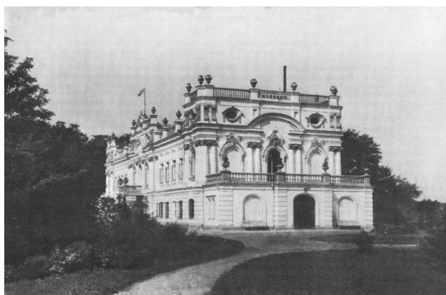
Рисунок 1 – Історичний вигляд палацу [1].