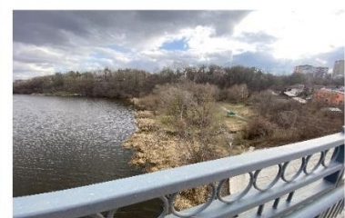
Сучасний вигляд парк Кумбари