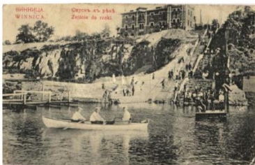
Сходи Г. Артинова на р. Південний Буг, початок XX ст.

Також згодом в парку встановлено пам'ятний знак на увічнення пам'яті козацького полковника Богуна, керівника успішної оборони Вінниці у 1651р. від військ польського гетьмана Калиновського. Історики пов'язують дану територію з місцем згаданих подій.