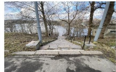
Сучасний вид на сходи арх. Г. Артинова