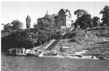
Спуск до переправи на р. Південний Буг, 1952 р.