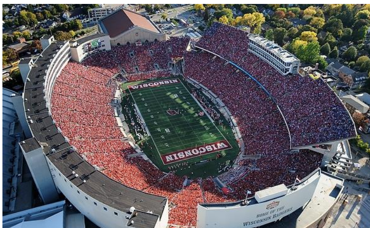
Рис. 3 Стадіон, штат Вісконсін

Стадіон "Camp Randall Stadium" (див. рис. 3), - символ історії та спортивного духу університету Вісконсін-Медісон. Його історія сягає 1917 року, коли спортивний комплекс був відкритий під час Першої світової війни. Однією з найвизначніших подій на стадіоні була "Біг Руди" у 1993 році, коли футбольна команда Вісконсіну здобула перемогу над Мічиганом у фінальній хвилині гри.