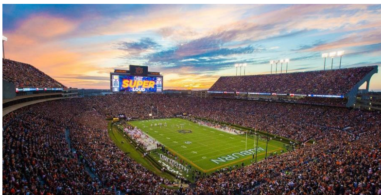
Рис. 1 Стадіон, штат Алабама

Jordan-Hare Stadium (див. рис. 1), - це великий стадіон, розташований у місті Олберн, штат Алабама. Він був відкритий у 1939 році та названий на честь тренерів футбольної команди Університету Алабама, Джордана та Гаре. Стадіон служив домашньою ареною для футбольної команди Алабама Tigers та був місцем для багатьох важливих подій, включаючи чемпіонати та історичні матчі.