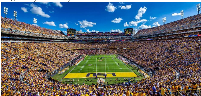
Рис.2 Стадіон Луїзіани

Tiger Stadium, (див. рис. 2) розташований в Батон-Руж, Луїзіана, є одним з найвідоміших спортивних об'єктів у Сполучених Штатах. Він був відкритий у 1924 році та є домашнім стадіоном для футбольної команди LSU Tigers. Стадіон також став місцем проведення численних визначних подій, включаючи матчі чемпіонату NCAA та концерти світових зірок, які привертають мільйони глядачів з усього світу.