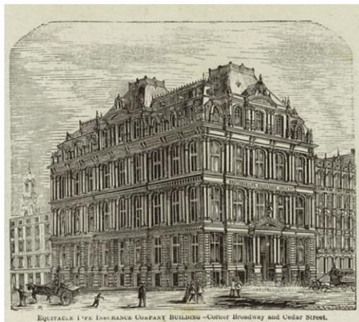
Рис. 3 - Equitable Building

Так у 1870 році «Equitable Building» (Див. рис. 3) став першим офісною будівлею з ліфтом, де факто це був перший хмарочос.