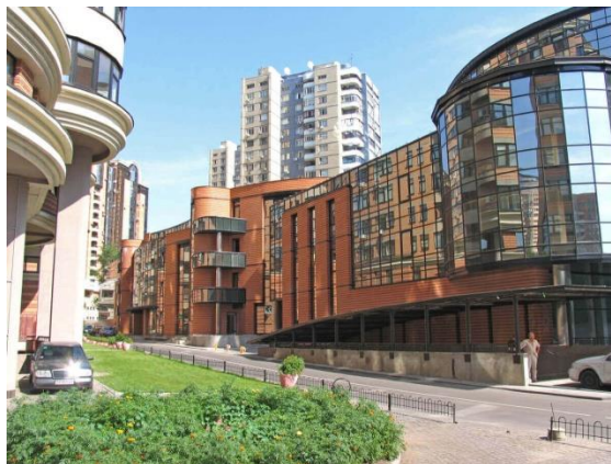
Рис. 5 – Офіс класу А

Офіси класу А – в основному теж вторинна реконструйована нерухомість, в якій організація планування не настільки ефективна, ніж в попередньому класі, можливо трохи нижча якість систем підтримки мікроклімату, і не підземні, а наземні місця для паркування.(Див. рис. 5) [15]