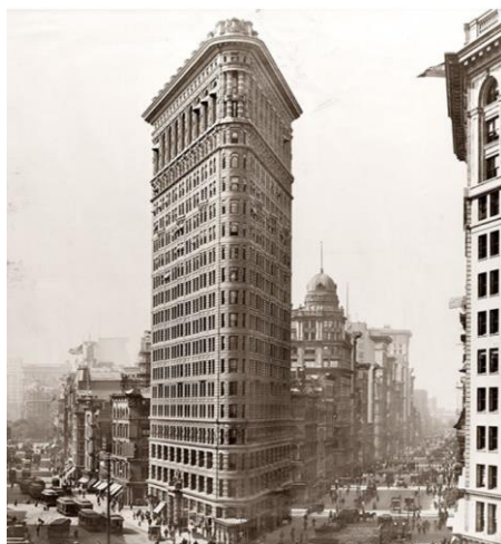
Рис. 4 - Equitable Building

світла і немає шуму з вулиці, а панорамне скління дає прекрасний вид на місто. Так у 1904 році був побудований «Flatiron Building» (Див. рис. 4)[14]