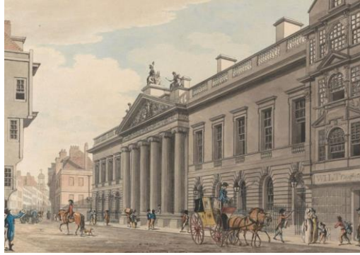
Рис. 1. East India House 1729 р., Великобританія