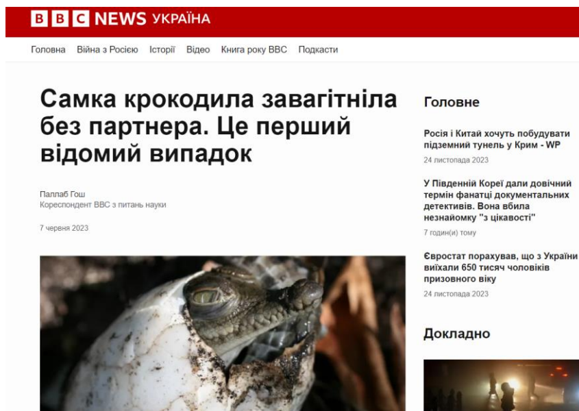
Рисунок 2 – Загальний вигляд інтерфейсного вікна сторінки сайту BBC Україна

BBC Earth (раніше відомий як BBC Earth) – це бренд та платформа BBC, спеціалізована на створенні та трансляції документальних програм, фільмів та серіалів про природу та тварин. BBC Earth відомий своєю вражаючою якістю зображення, науковою точністю та найвищим рівнем розкриття різноманітних аспектів природи та життя на планеті Земля (рис. 2). Планета Земля (Earth) вперше вийшла на екрани у Великій Британії на каналі BBC One в березні 2006 року, а в США через рік на каналі Discovery. До червня 2007 фільм було показано в 130 країнах по всьому світу [5].