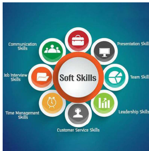
Рис. 1. Необхідні для успіху у XXI ст. гнучкі навички

Компетенції, необхідні на новому ринку праці, швидко змінюються, і стара парадигма наявності висококваліфікованих фахівців в одній конкретній галузі або іншої крайності наявності широкого спеціаліста без глибоких знань з будь-якої спеціальності вже не є ефективною. Нові позиції на ринку праці вимагають багатодисциплінарного набору навичок, що забезпечує поєднання попередніх двох парадигм (рис. 2) [2].