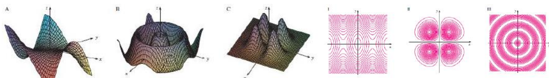
Рис.2. Візуалізація поверхонь та їх перерізів

Зупинимось на проблемах: читання зображень просторових об'єктів, невміння їх зображати; сприйняття двовимірних графіків як просторових, визначення відношення між окремими елементами зображених двовимірних об'єктів, зокрема графіків функцій; подумки змінювати взаємне розташування елементів, розчленовувати об'єкт або скласти новий [5]. Використання систем комп'ютерної математики у навчальній діяльності дає можливість наблизити процес навчання до реального процесу пізнання понять з використанням різних програмних засобів, зазвичай деяких спеціальних програм для побудови зображення. На рис. 2 наведено приклади завдань щодо оцінювання рівня набутих знань, їх систематизації та змістовності за результатами вивчення функцій багатьох змінних. Візуалізація доповнює пізнавальний процес, дає змістовні знання про математичні об'єкти. Так, під час вивчення теми “Умовний екстремум” студентам не завжди зрозуміло, чому так називається цей екстремум, та що він собою являє. Якщо побудувати за допомогою систем комп'ютерної математики перерізи поверхні та площини, або двох поверхонь, то можна побачити точки екстремуму, що належать перерізу та задовольняють умову задачі.