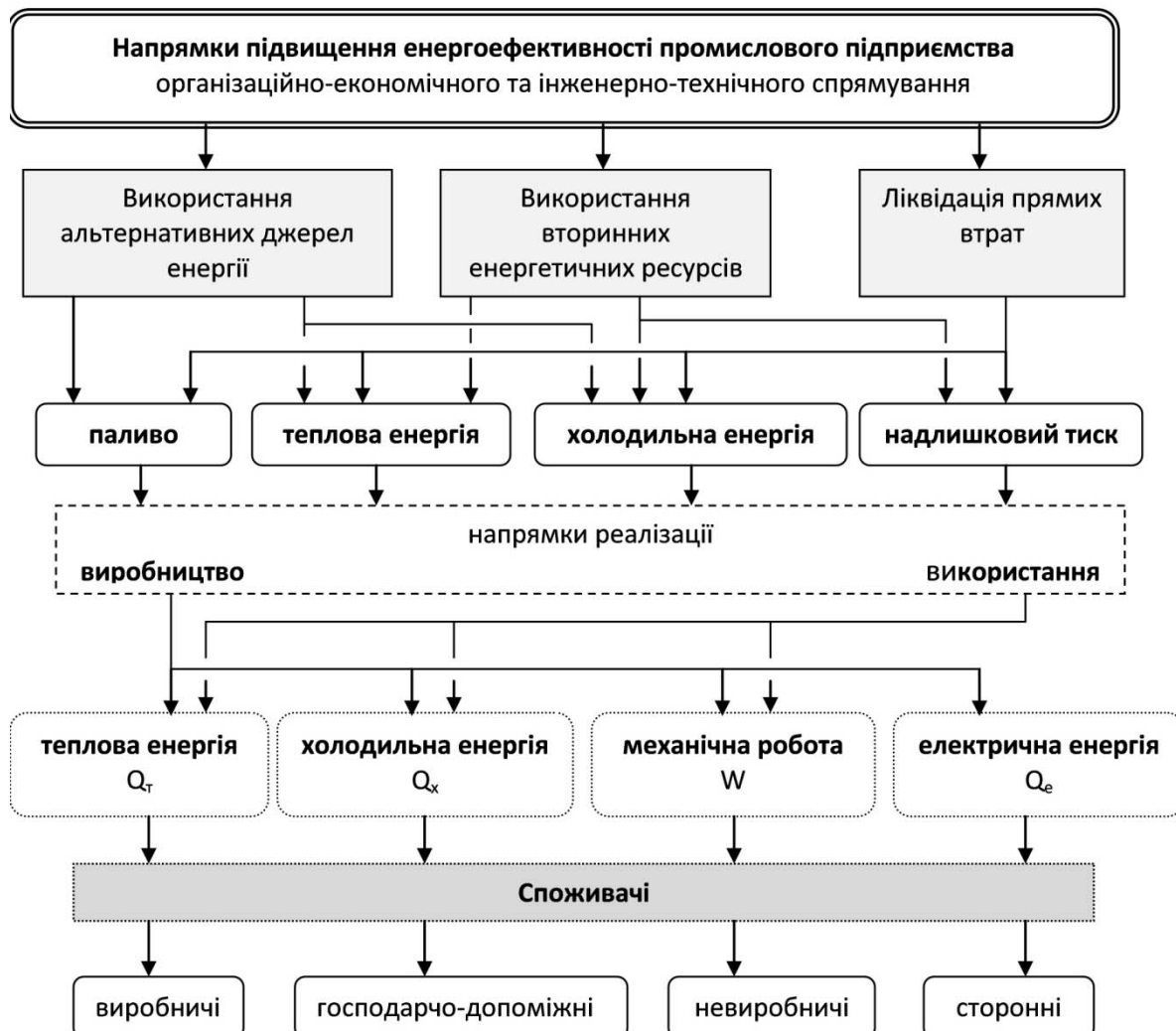
Рис. 2. Напрямки організаційно-економічного і інженерно-технічного спрямування підвищення енергоефективності промислового підприємства (розроблено автором)

Аналіз узагальнюючої схеми розподілу енергетичних ресурсів технологічної установки як ключової структурної одиниці промислового підприємства дозволяє окреслити основні напрямки підвищення енергоефективності виробництва: ліквідація прямих втрат, максимальне використання вторинних відновлювальних ресурсів та альтернативних джерел енергії (рис. 2). Використання альтернативних джерел енергії дозволяє використовувати нетрадиційні палива: біогаз та біомасу. Отримати теплову енергію можна від сонця, холодильну енергію – від навколишнього середовища та підземних вод. Отриману альтернативну енергію можна використовувати безпосередньо на виробництві або для генерації інших видів енергії – електричної – від сонячних батарей або вітрових генераторів, механічної роботи різних машин. Споживачами можуть виступати виробничі, невиробничі, господарсько-побутові ланки підприємства або сторонні споживачі, що не належать до даного підприємства. Вторинні енергетичні ресурси у вигляді теплової та холодильної енергії і надлишкового тиску також можуть використовуватися безпосередньо або за допомогою утилізаторів на виробництво теплової, холодильної, електричної енергії і механічної роботи для вищезначених груп споживачів.