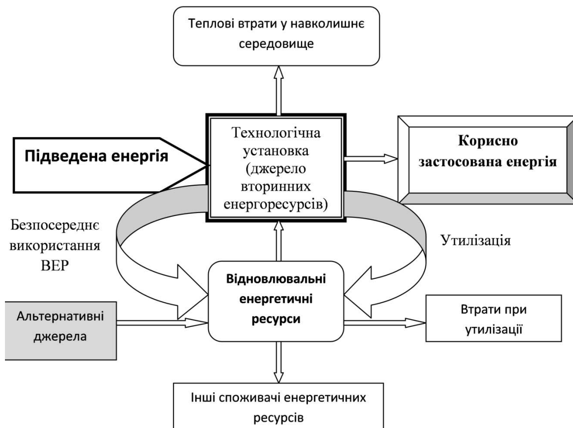
Рис. 1. Узагальнююча схема розподілу енергетичних ресурсів технологічної установки промислового підприємства (розроблено автором)

Основним кінцевим споживачем енергії на підприємстві є технологічна установка (рис. 1). До технологічних установок промислового підприємства можна віднести не тільки установки, що безпосередньо використовуються у виробничому процесі, але і допоміжні пристрої, верстати, конвеєри, печі, підйомники, компресори, котли, вентилятори та інше. Після проходження технологічного процесу утворюється кінцевий продукт і енергетичні та фізичні відходи. Енергія, що безпосередньо використана на виготовлення кінцевого продукту – це корисно застосована енергія. Під час проходження процесу неминучими є теплові втрати від нагрітого обладнання: печей, двигунів, механізмів, систем тепlopостачання та інших. Дана енергія є втраченою для установки, але в загальному тепловому балансі підприємства вона враховується, наприклад, на опалення цехів у холодний період. Якщо теплових втрат багато і для їх виведення з цеху необхідно встановлення додаткового холодильного обладнання, то дані відходи вже розглядаються як втрати теплової енергії. Для використання вторинних енергетичних ресурсів у енергетичному балансі підприємства потрібно розглянути структурну схему розподілу енергоресурсів технологічної установки промислового підприємства (рис. 1).