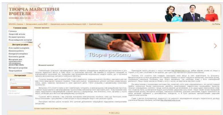
Рисунок 3 - Стартова сторінка системи http://dorobok.edu.vn.ua

Ця система забезпечує відкритість та прозорість проведення різного роду конкурсів, що їх проводить керівництво освітою як серед учителів, так і серед закладів освіти. Учасники конкурсу мають можливість викласти у відкритий доступ для ознайомлення усіма бажаючими свої конкурсні матеріали. Журі відповідного конкурсу має можливість в режимі он-лайн виставити оцінки згідно оголошених на сайті критеріїв, а всі бажаючі можуть з ними ознайомитися.