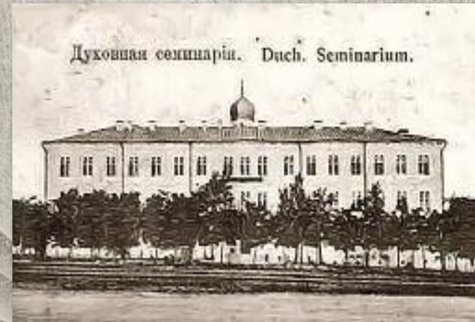
Подільська духовна семінарія

У 1873–1879 роках навчався в Подільській духовній семінарії в м. Кам'янці. Згодом вступив до Київської духовної академії, академічний курс якої закінчив зі ступенем «кандидат богослов'я».