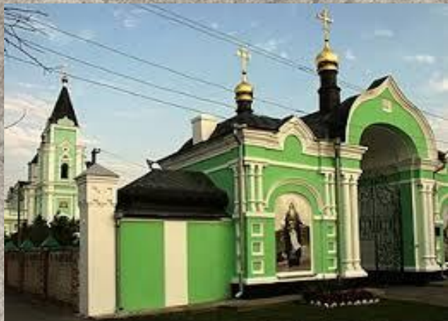
Брама Свято-Троїцького Браїлівського жіночого монастиря