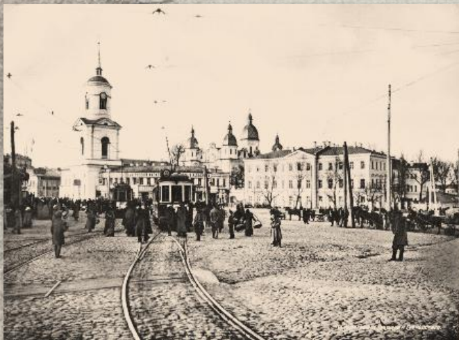
Київська духовна академія та Братський монастир, 1911 р.