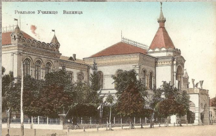
Вінницьке реальне училище. Листівка поч. ХХ ст.