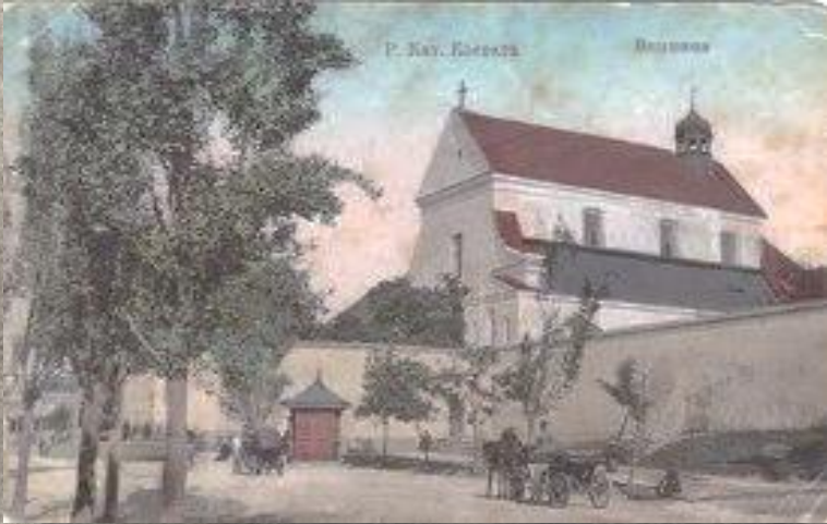
Монастир капуцинів у Вінниці. Листівка поч. XX ст.

Іван Шипович писав не тільки про народні виступи, а й про нашестя сарани, епідемії холери та чуми, про те, як вулицю Поштову уклали каменем перед приїздом Олександра I, як напередодні війни 1812 року робив огляд військ князь Багратіон, як до Вінниці із синами приїздив Микола I.