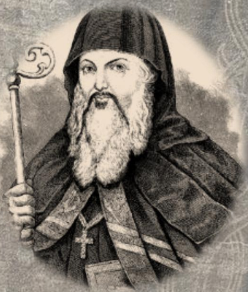
Єпископ Гедеон Тригорій Балабан

Із жовтня 1882 року працював у Подільській духовній семінарії на посаді помічника інспектора в Кам'яниці-Подільському. Саме тут став членом Подільського церковного історико-археологічного товариства і розпочав роботу з дослідження церковно-історичної спадщини краю.