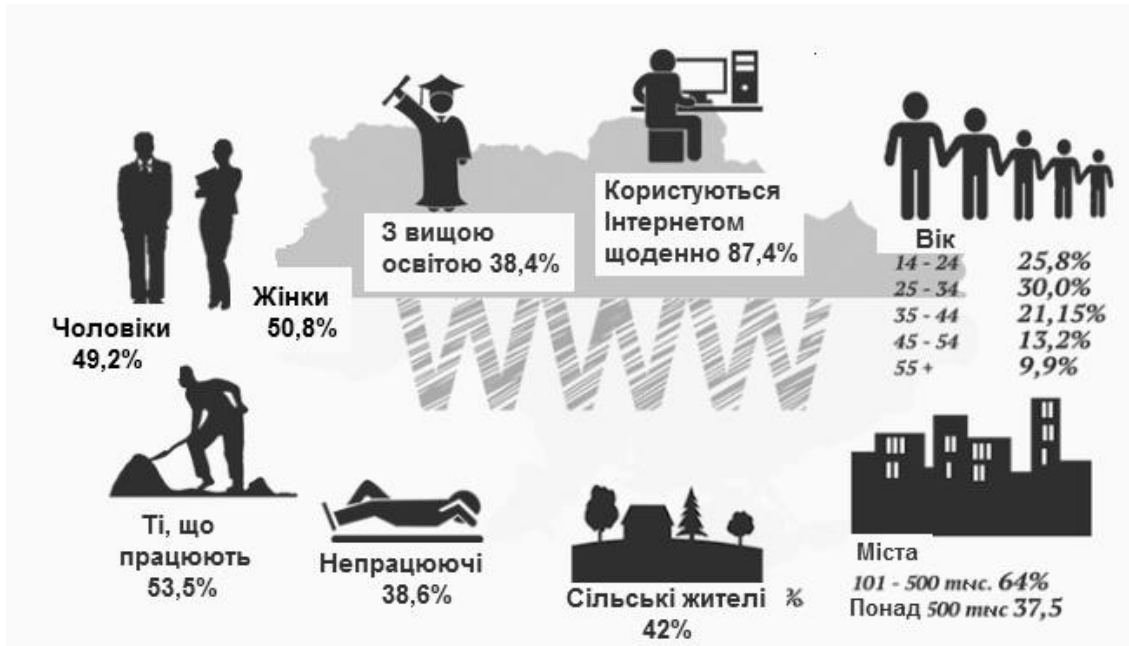
Рис 1. Портрет Інтернет в Україні станом на кінець 2014 року

Кількість українських Інтернет-користувачів, тобто людей, які взагалі коли-небудь отримували доступ до веб-мережі, з 2009 по 2013 зросла на 41.8%. На сьогоднішній день Україна посідає 32 місце серед 198 країн за кількістю Інтернет-користувачів у світі [2].