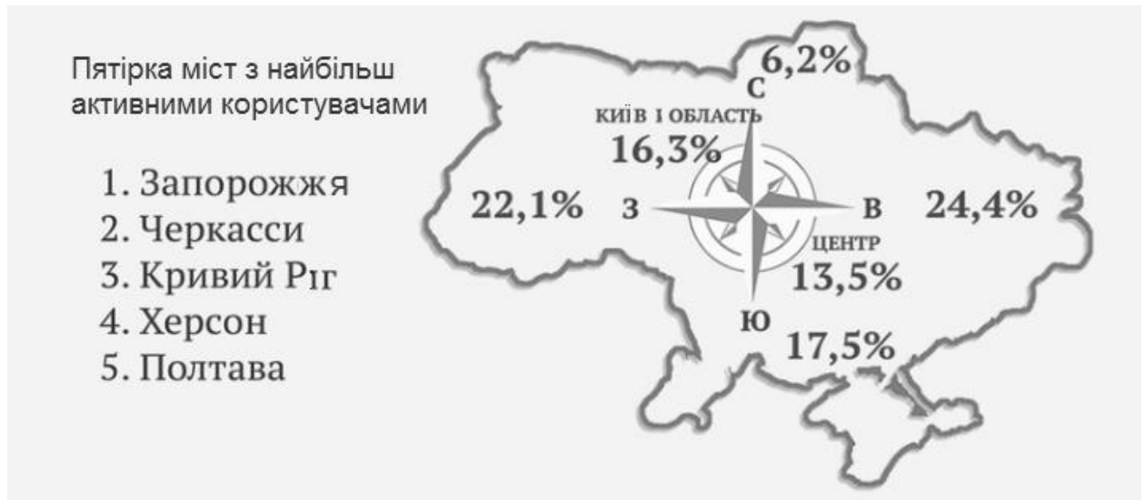
Рис. 2. Активність Інтернет-користувачів

Кількість українських Інтернет-користувачів, тобто людей, які взагалі коли-небудь отримували доступ до веб-мережі, з 2009 по 2013 зросла на 41.8%. На сьогоднішній день Україна посідає 32 місце серед 198 країн за кількістю Інтернет-користувачів у світі [2].