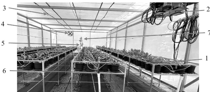
Рисунок 1 – Теплиця з автоматичною системою мікроклімату

Для забезпечення сталого значення вологості повітря в середині замкнутого об'єму повітря тепличного об'єкта використовують різні типи зволоження. Це може бути природне зволоження, крапельне зволоження, туманоутворююче зволоження, зрошення огороджувальної конструкції та автоматичні системи мікроклімату. Автоматичні системи зволоження складаються з: контролера (5), система туманоутворення (3), системи повітрообміну (4), крапельного поливу (6), системи освітлення та обігріву (2), а також датчиків (1,7) (рисунк 1) [3,4]: