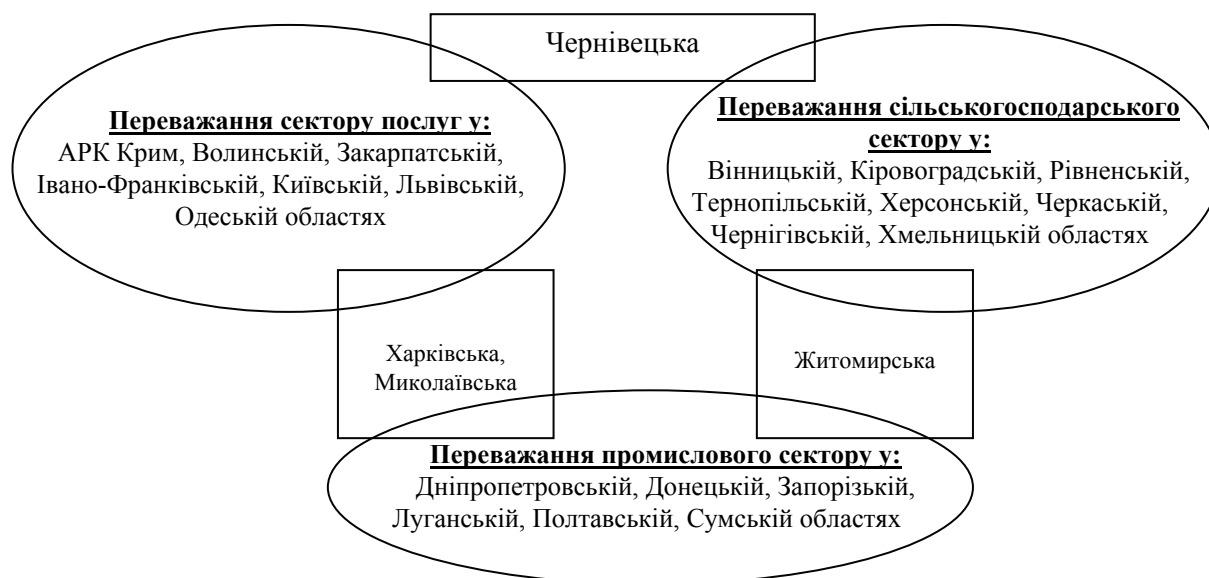
Рис. 1. Типологізація регіонів України за домінуванням у їх економіці відповідних секторів економіки (розрахунки проводились на основі даних Державної служби статистики України [1])

Таким чином, типологізація регіонів буде здійснюватись відповідно до умови, що зазначена у нерівності (1). Так, якщо у економіці регіону частка одного сектору більше за середню частку цього сектору по економіці України, а частки двох інших секторів менші за аналогічні середні показники, то вважатимемо, що цей сектор є домінуючим. Якщо в результаті обстеження виявляються регіони, для яких нерівність (1) не виконується, то вважатимемо, що в економіці цих регіонів наявне домінування декількох секторів. Нижче на рисунку подамо розподіл регіонів за домінуючим сектором економіки.