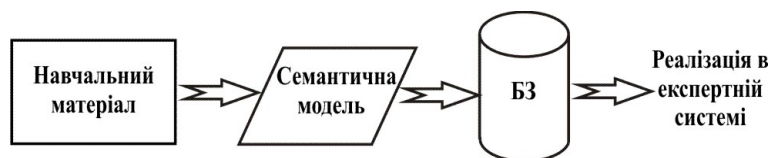
Рис. 1. Етапи побудови ЕС

Побудова такої ЕС передбачає проходження декількох етапів рис. 1: