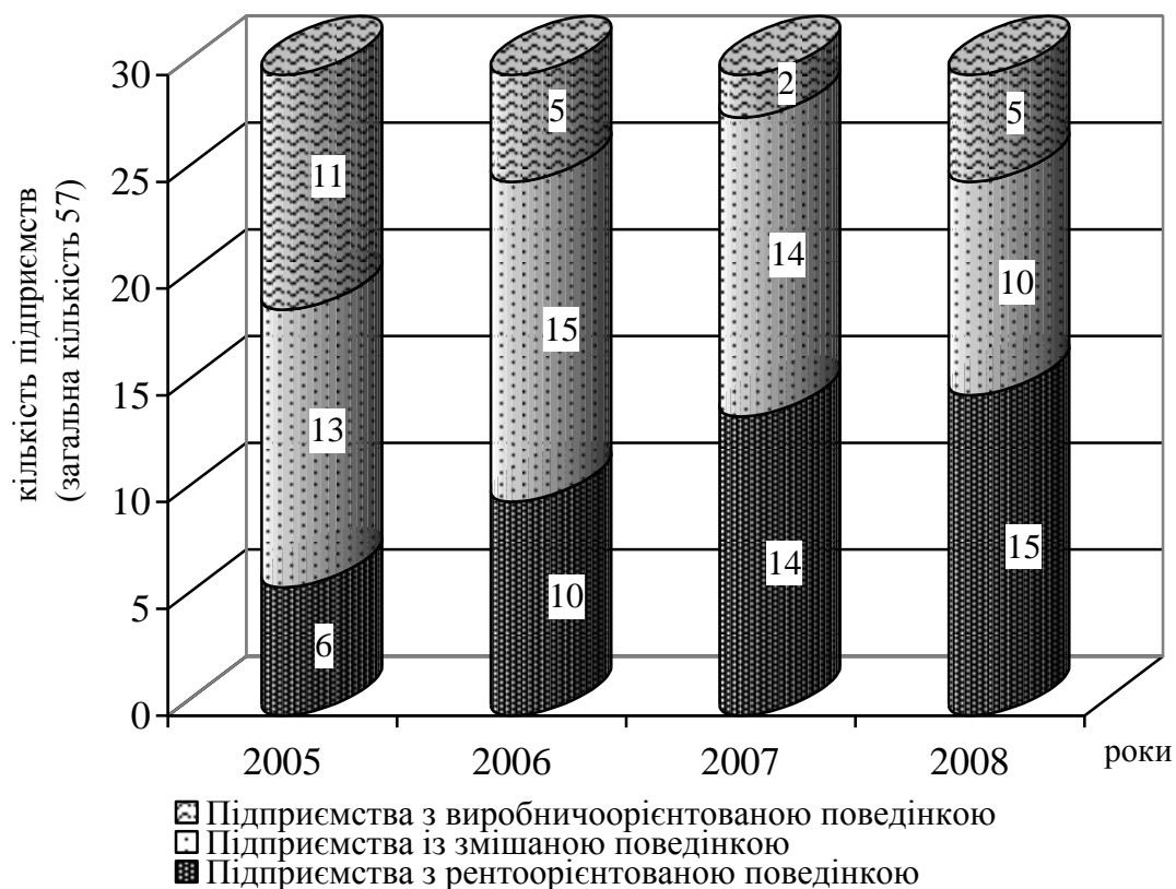
Рис. 2. Узагальнена динаміка кількості підприємств сільськогосподарського машинобудування за моделями економічної поведінки (дані за період 2002–2008 рр.)

2002–2007 рр., що надало можливість ідентифікувати економічну поведінку підприємств із відповідними моделями за 2005 р., 2006 р., 2007 р.. Отримані результати свідчать про поступове зменшення підприємств із виробничоорієнтованою поведінкою – з 11 до 5 (на 54,5 %), зменшення підприємств із змішаною поведінкою – з 13 до 10 (на 30 %) та стрімке збільшення підприємств із рентоорієнтованою поведінкою – з 6 до 15 (на 150 %) (рис. 2).