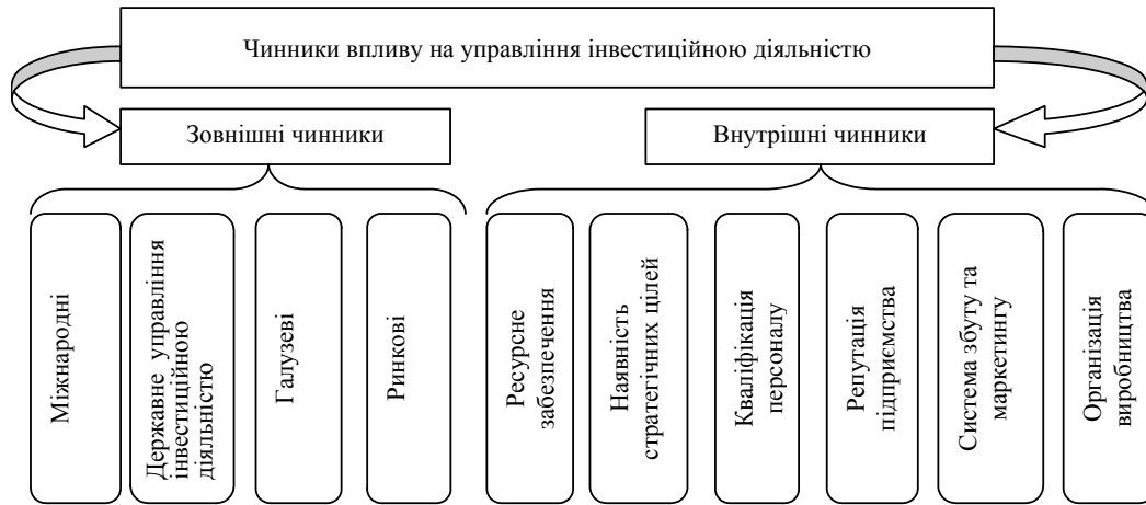
Рис. 2. Систематизовані чинники впливу на управління інвестиційною діяльністю промислових підприємств

Кожна з зазначених груп чинників опосередковано впливає на процес управління інвестиційною діяльністю, проте, у випадку відсутності оперативного реагування на них з боку керівництва, може призвести до негативних наслідків. Внутрішні чинники впливу на управління інвестиційною діяльністю визначаються діяльністю промислового підприємства в цілому, рівнем кваліфікації персоналу, здатністю керівництва та персоналу вчасно реагувати на зміни у зовнішньому середовищі, рівнем ділової активності та репутації підприємства, розвиненістю системи збуту та маркетингу, процесом організації виробництва, наявністю необхідного ресурсного забезпечення.