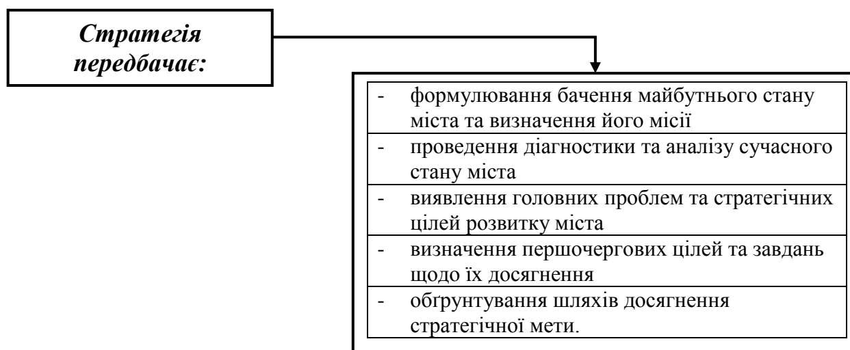
Рис. 1 – Головні завдання стратегії розвитку міста

Розробники методик формування стратегій виділяють такі головні їх завдання (рис. 1) [1–4].