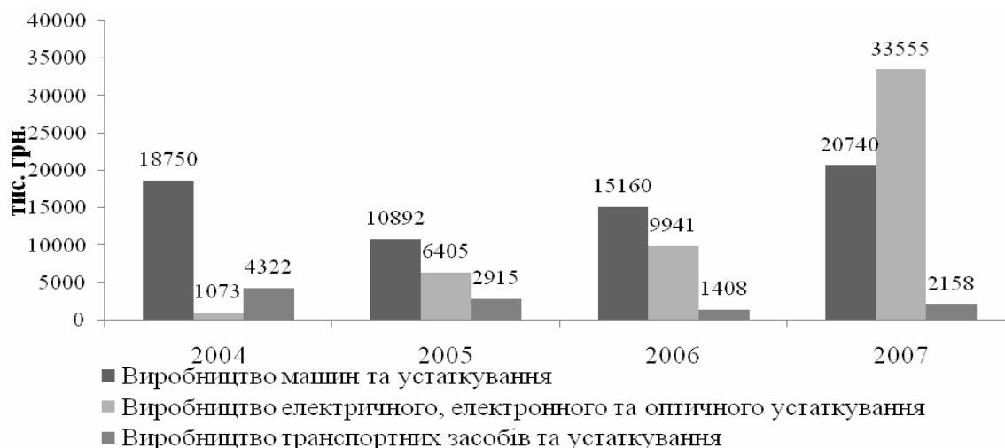
Рис. 2. Обсяги інвестицій в основний капітал підприємств машинобудування Вінниччини (тис. грн.) (за даними [6])

Одним з основних напрямків підвищення ефективності управління інвестиційними процесами на машинобудівних підприємствах є використання комплексного інтегрованого підходу до інвестування. Комплексне інвестиційне управління – це системно інтегрований процес управління сукупністю інвестиційних проектів, які підпорядковані