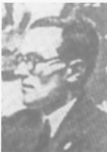
Леонід Мосендз (1897–1948 рр.), випускник Вінницької вчительської семінарії, учасник українських визвольних змагань

На літературному вечорі в 1927 р. з доповіддю «Українська література за десять років» виступив критик Володимир Коряк, читали свої твори приїжджі письменники А. Дикий, І. Микитенко, Л. Первомайський, В. Союра. Приїздили до Вінниці в 20-і рр. І. Бабель, О. Безименський, Д. Гофштейн, О. Корнійчук, П. Тичина.