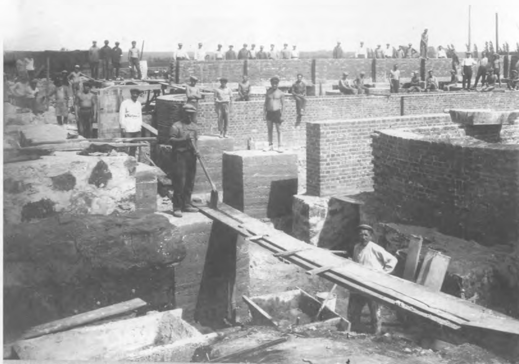
На будівельному майданчику суперфосфатного заводу

У кінці 20-х рр. почалася радіофікація міста шляхом встановлення в квартирах трансляційних точок, а на вулицях гучномовців. Запрацювала не лише міська радіостанція, але й численні радіоприймальні установи в окремих громадян.