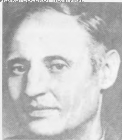
Юрій Клен (1891–1947 рр.), справжнє прізвище Освальд Бургардт. Автор поеми «Прокляті роки». Помер в Аугсбурзі (Німеччина)

Впровадження НЕПу відбувалося одночасно з культурологічними реформами в Україні, в тому числі й на Поділлі. Не відчуваючи широкої суспільної підтримки з боку місцевого українського населення, більшовики змушені були обережно підходити до вирішення національного питання і відмовитись від відверто проімперської, русифікаторської політики.