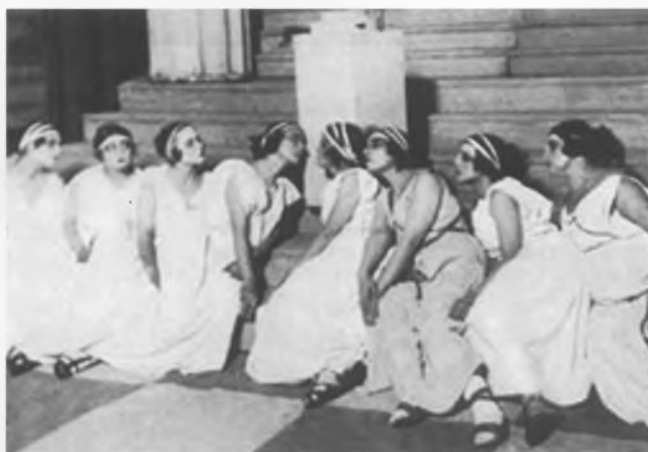
Сцена з вистави «Цар Едип» у постановці Г. Юри. 1921 р.