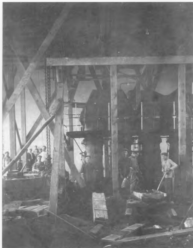
Будівництво одного з цехів суперфосфатного заводу

Влада вимагала провести кампанію з метою популяризації радіо. З 15 лютого 1925 р. розпочинається діяльність Подільського товариства «Друзів радіо». У 1925 р. найбільш активною була діяльність товариства у Вінниці, де функціонували 14 уповноважених. Усього нараховувалося 635 членів товариства, які платили членські внески. У квітні 1925 р. було проведено 6 радіоконцертів з оплатою. Товариство користувалося радіостанцією поштово-телеграфної контори, влаштувало концерти, розповсюджувало знання про радіофікацію та радіомовлення, організувало спеціальні радіокурси.