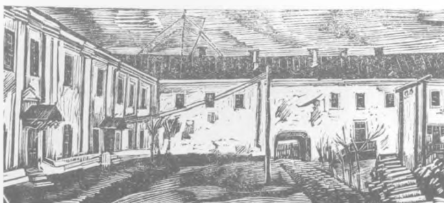
Вінницька Державна друкарня в Мурах (вид з подвір'я)

З переходом до НЕПу друкарні були зняті з державного постачання і переведені на принцип самоокупності. Необхідність розрахунку за свої замовлення спонукала всі заклади скоротити вимоги на друкарські робо-