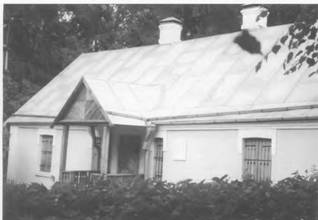
Музей М. М. Коцюбинського

ВІННИЦЬКА ОБЛАСНА КОМІСІЯ УВІЧНЕННЯ ПАМ'ЯТИ М. КОЦЮБИНСЬКОГО ТА ОБЛАСНИЙ ВІДДІЛ НАРОДНОЇ ОСВІТИ