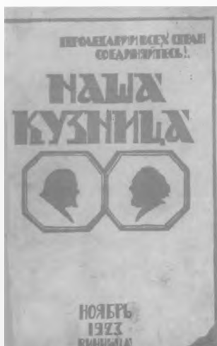
Орган Подільського губкому КП(б)У — щомісячний журнал «Наша кузниця», віддрукований у Вінницькій держдрукарні

руги (1923) засновуються газети окружних масштабів. У Вінниці — «Селянська газета». В листопаді 1925 р. Кабінет виучування Поділля, що займався дослідженням історії, економіки та природи краю, починає випускати «Інформаційний огляд краєзнавчої праці на Поділля». У 1926 р. виходить «Вінницька газета» — орган Вінницького міському КП(б)У та міськвиконкому.