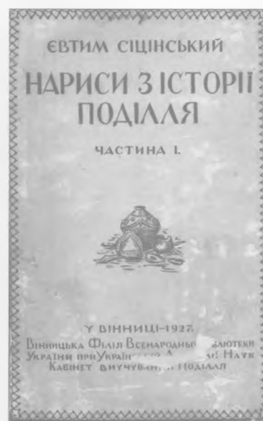
Історичні та краєзнавчі видання Кабінету вивчення Поділля 20-х років ХХ ст.

З 1921 р. українські навчальні заклади перетворюються на радянські трудові школи. Навчальні плани, програми відповідали комуністичним «інтернаціональним» принципам, з одного боку, а з другого — поглиблювали українізацію шкіл. Це призвело до того, що окремі вчительські групи, які підтримували повстанців, та учительство вінницьких педагогічних курсів продовжували виховання молоді в дусі національних традицій. Влада застосовувала до непокірних вчителів репресії. Губернська надзвичайна комісія у 1923 р. засудила 106 освітян: 25 з них до страти, 56 до різних термінів ув'язнення, 25 звільнено з роботи 45 .