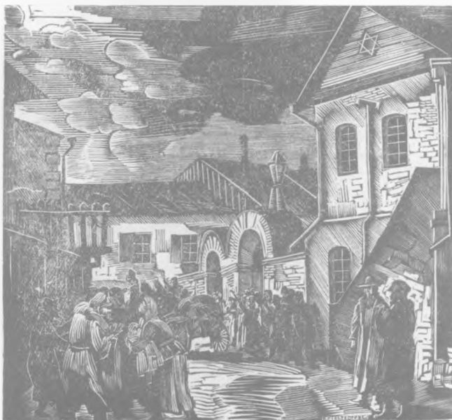
Дереворит В. Сільвестрова з оформлення книги М. Коцюбинського «Він іде», виданої у Державній Вінницькій друкарні з нагоди 67-річчя від дня народження автора

В умовах встановлення диктатури пролетаріату задовольнялися інтереси передусім робітничого класу, а культурна політика відповідала ідеї прищеплення комуністичних ідеалів та забезпечення народного господарства необхідною кількістю кваліфікованої робочої сили. На вирішення цих завдань була спрямована освітня реформа, яка здійснювалась в період запровадження НЕПу. В 1922 р. було затверджено Кодекс законів про народну освіту УРСР, в якому проголошувалася боротьба за розкріпачення трудящих мас від духовного рабства, розвиток самосвідомості, створення нового покоління