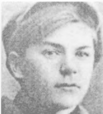
Панько Педа (1907–1937 рр.), завідував літчастиною Одеського оперного театру. Автор єдиної збірки «Перший рейд» і помертної «Горять вогні»

Вінницьке літературне об'єднання випускало альманахи, запрошувало на зустрічі до міста письменників, брало участь у вшануванні пам'яті М. Коцюбинського. Так, у травні 1926 р. в міському театрі відбулася «прилюдна вечірка», на якій доповідь про життя і творчість М. Коцюбинського виголосив відомий учений Микола Зеров, зі спогадами виступив художник Михайло Жук.