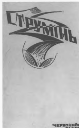
Збірка художніх творів вінницьких письменників, започаткована газетою «Червоний край»

До 17 квітня 1923 р. виходила «Рабоче-крестьянская газета» — орган Подільського губкому КП(б)У, губвиконкому та губпрофради. Її замінили «Известия Подольского губкома КП(б)У, подгубисполкома и губпрофсовета». В 1924 р. ця газета одержує назву «Червоний край» — орган губкому КП(б)У й губвиконкому. Двічі на тиждень вона видавала значний за обсягом додаток «Сільське господарство». Одночасно виходила ще одна газета — «Червоне село» — орган Подільського губкому КП(б)У і губкомісії КНС. З поділом на ок-