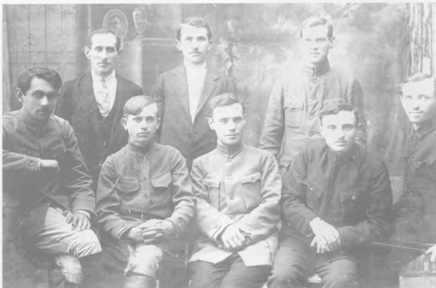
Члени губвідділу друкарів

У квітні 1921 р. у Вінниці почала виходити газета «Подольський пролетарий», а згодом — «Вісті», «Червоне село», «Рабоче-крестьянская газета» та журнал «Пролетарська освіта». З 1922 р. видається щомісячний журнал «Наша кузниця» — орган Подільського губкому КП(б)У.