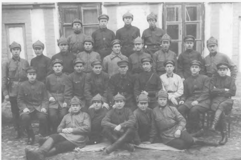
Працівники окружного військового комісаріату

Політична ситуація залишалася складною, бо наприкінці серпня – на початку вересня 1920 р. україн-